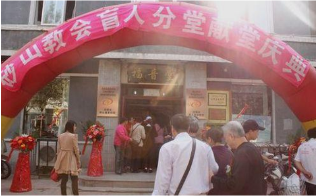
Sandhill kirke for blinde åbnes i Shenyang, Dongbei